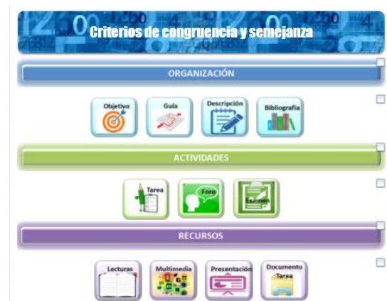
Figura 4 Contenido de cada unidad.