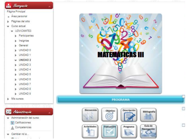
Figura 2 Administración del curso.

En la página principal del curso de matemáticas III, se encuentra el programa el cual contiene: la bienvenida, objetivo, descripción, bibliografía, actividades, evaluación, programa, guía de navegación. Como se observa en la Fig. 1.