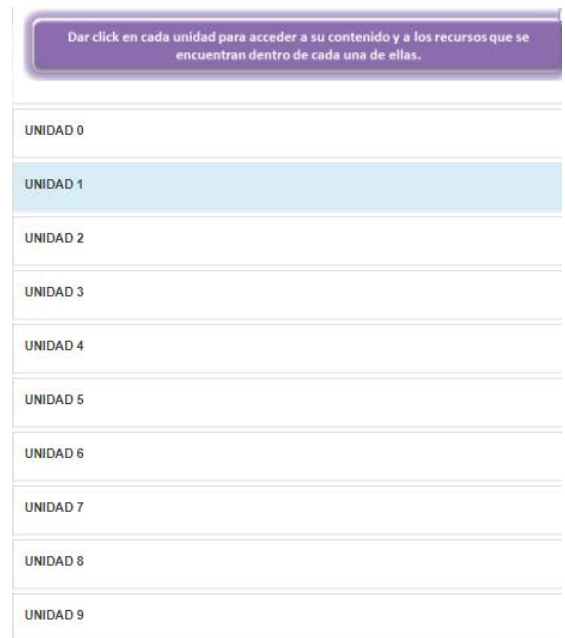
Figura 3 Unidades incluidas en el entorno virtual.

En la parte de abajo del programa se encuentran las nueve unidades que conforman el curso de matemáticas III (Fig. 3), las cuales se encuentran distribuidas en el entorno virtual y para poder acceder al contenido de cada uno de ellos es necesario darle un click a cada unidad.