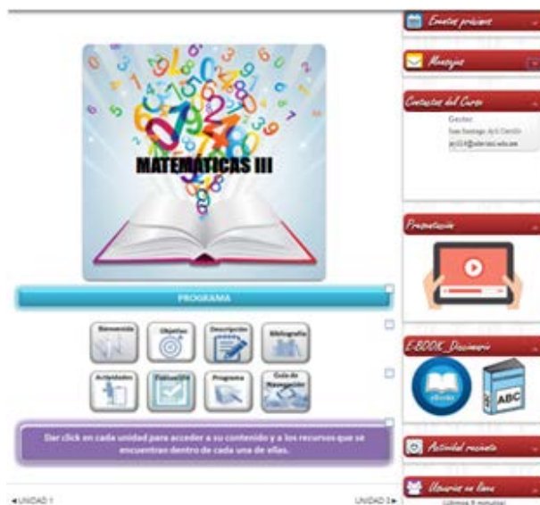
Figura 5 Calendario, actividades, e-book, entre otros.

Mientras el alumno continúa navegando en el entorno, al posicionarse en el cursor en la parte izquierda de la página principal, podrá tener acceso a un calendario donde se muestran los eventos próximos, mensajes, contactos del curso, video de presentación, E-BOOK y diccionario (Fig. 5), así como la actividad reciente y los usuarios que se encuentren en línea.